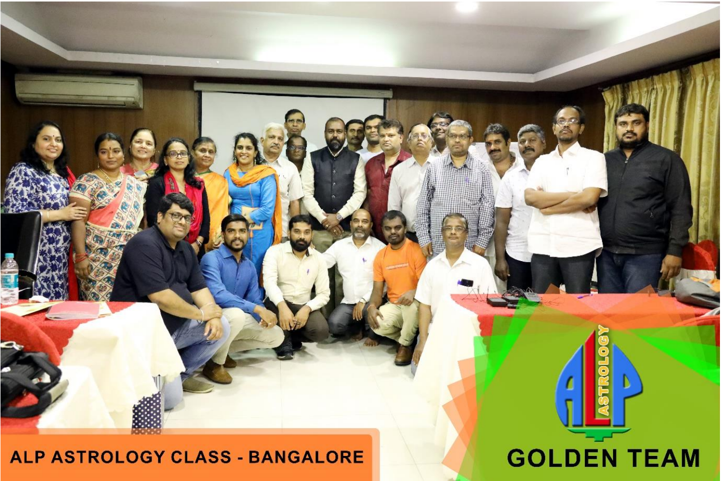
ALP ASTROLOGY CLASS - BANGALORE